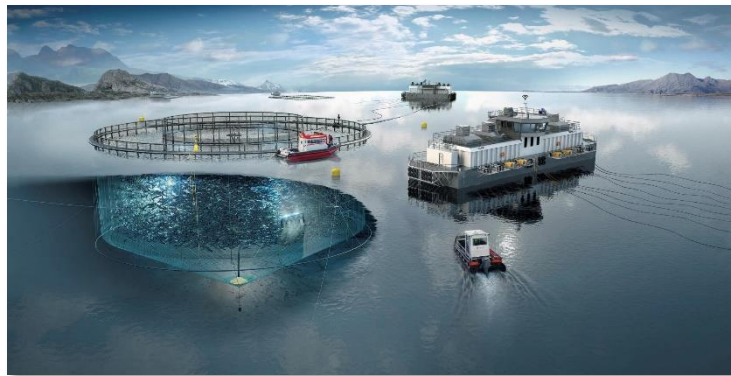
《最先端海面養殖イメージ写真》

《記事閲覧リンク》 https://lib.suisan-shinkou.or.jp/ssw620/ssw620-01.html